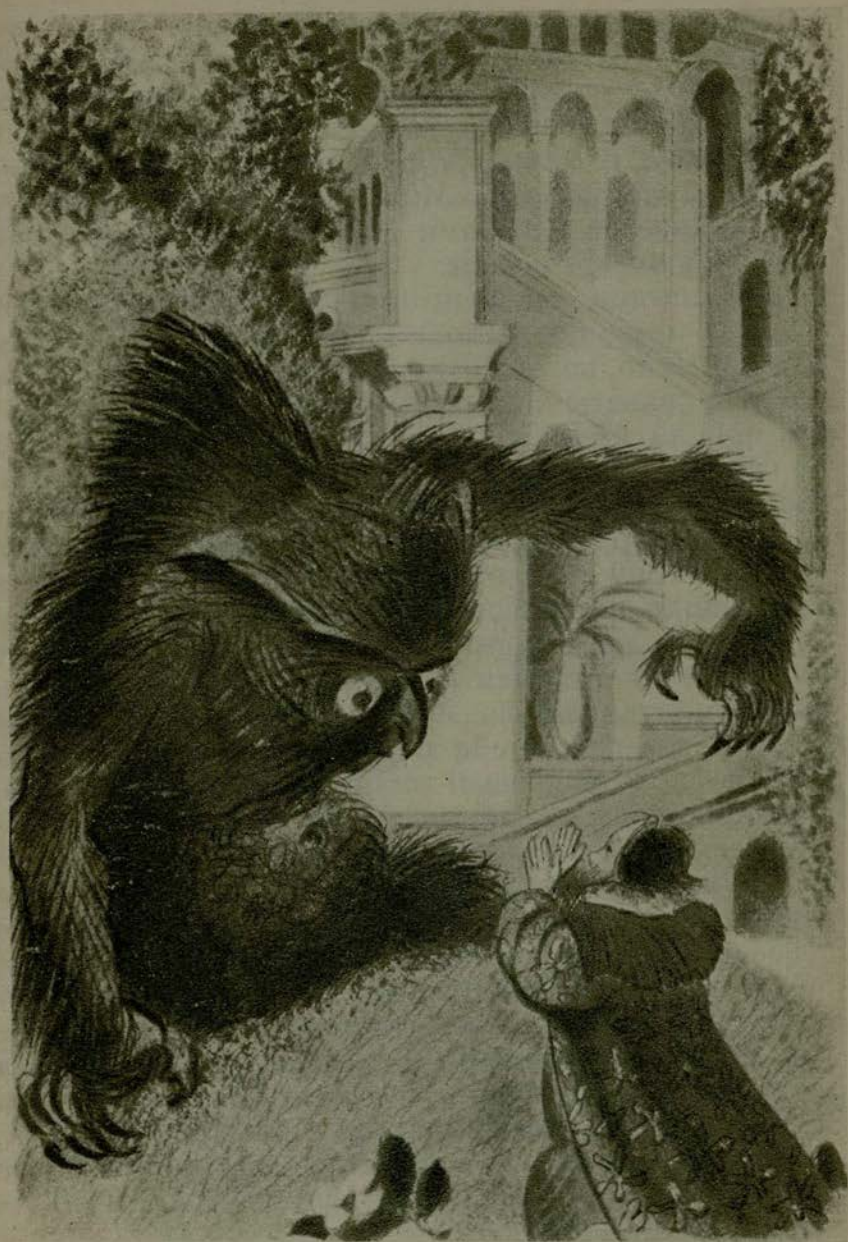
Он упал на колени перед хозяином, чудищем мохнатым.