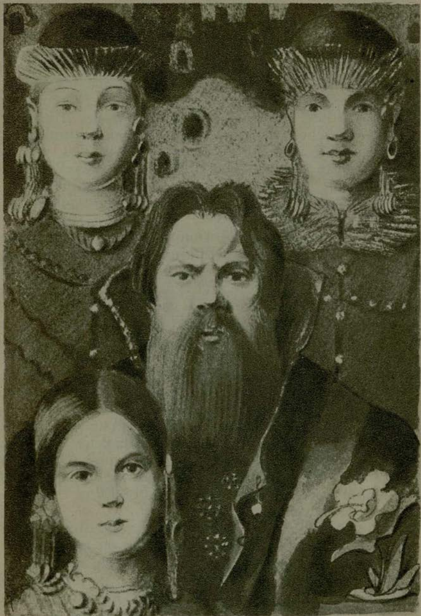
Было у купца три дочери, все три красавицы писаные.