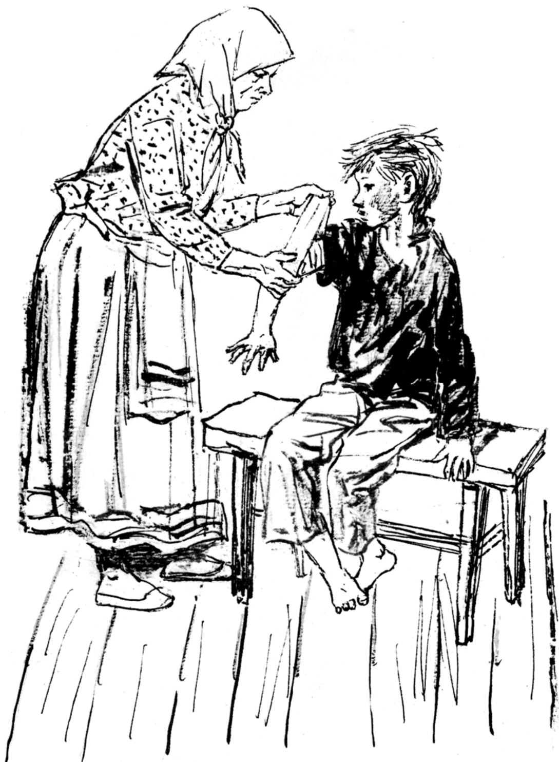
Мать ему руку салом смазала, приложила свежий лопух и чистым лоскутом завязала.