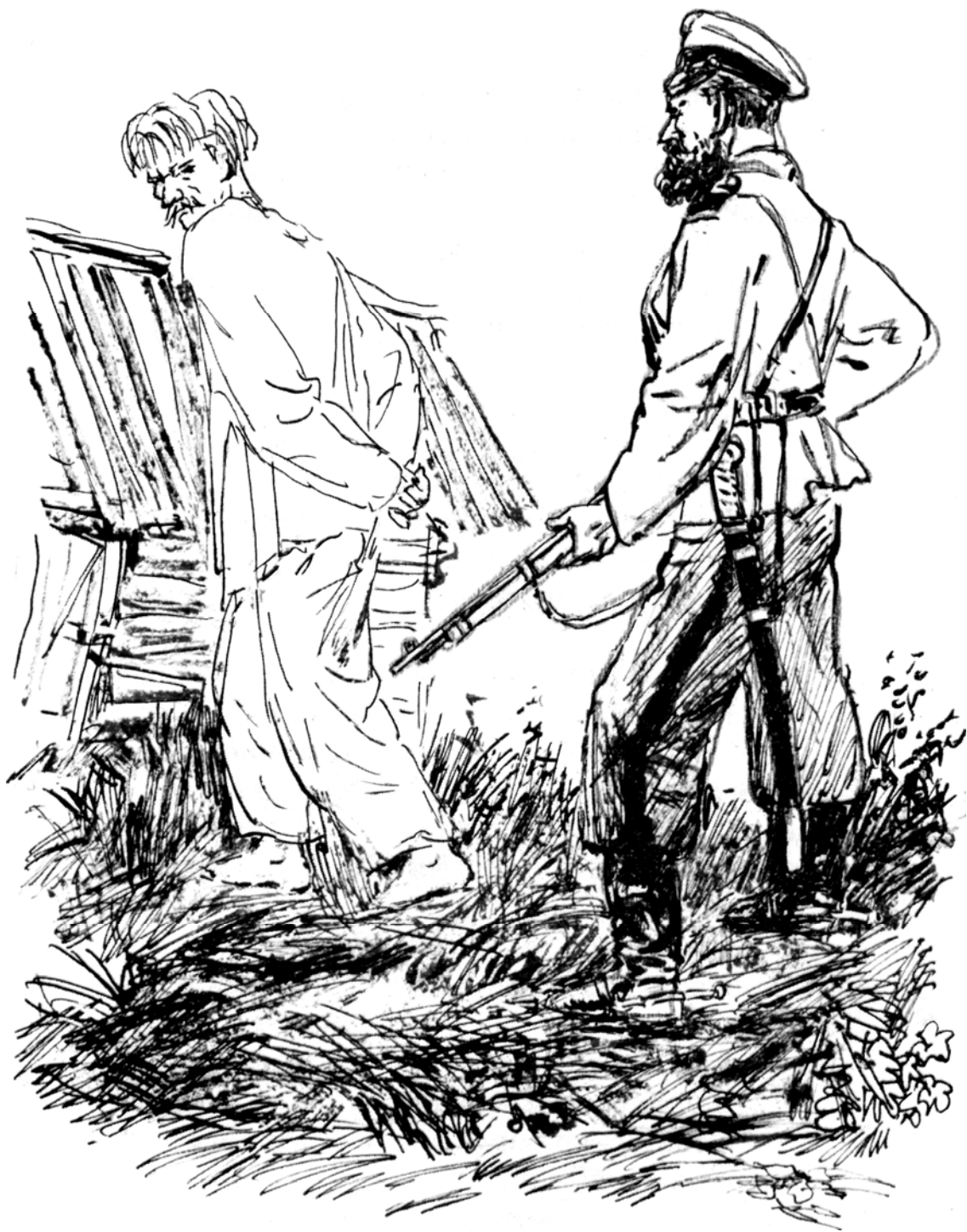
Посадили теперь под замок и дядю Егора.