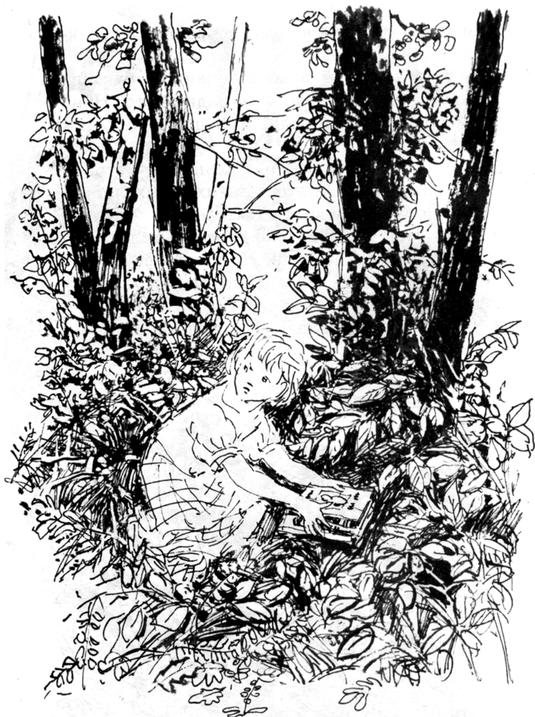
Нина положила пакет с завтраком и связку книг под куст.